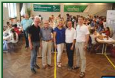
Viel Prominenz bei der Eröffnung