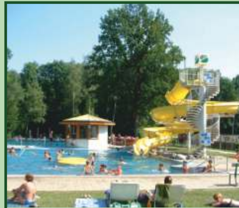
Im Freibad macht es mächtig Spaß!